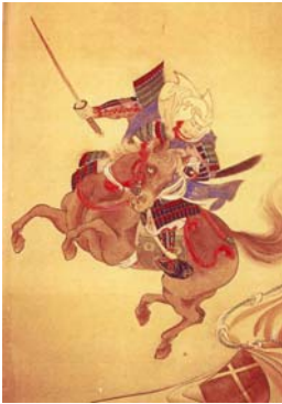
上杉謙信公 三太刀七太刀