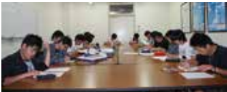
日商簿記3級の受験対策講習会

また、情報処理関連資格、簿記関連資格の受験希望者がこれまで毎年入ってきました。受験指導だけでなくプログラム作成なども個別に指導しています。資格取得に限らず、何かにチャレンジする学生を求めます。