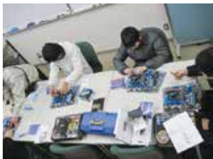
パソコンの組立に挑戦